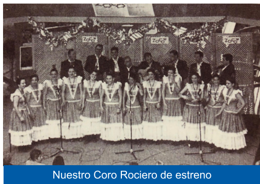
Nuestro Coro Rociero de estreno

de plata en filigrana cordobesa. Los hombres pantalón color camel y chaquetilla marrón. Con un ambiente de alegría y verdadera hermandad vivimos los primeros días de mayo alrededor de la cruz montada en el patio de nuestra Casa Hermandad y que como en años precedentes instala, anima y lleva su organización el coro rociero.