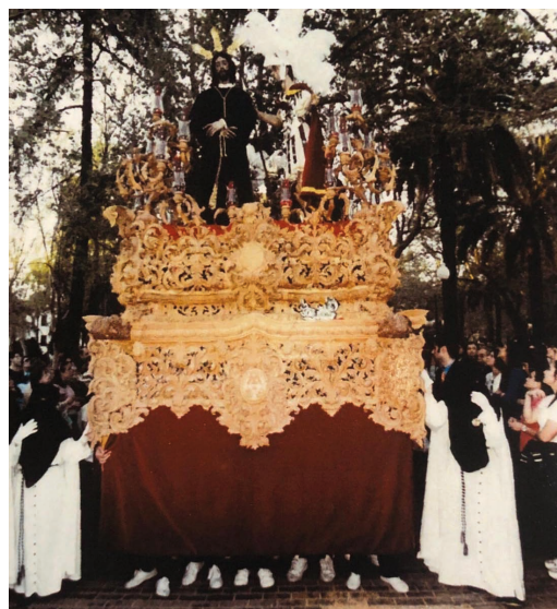
El Paso con la talla completa por los Jardines de Colón / 1999

salida de nuestra hermandad en la Estación de Penitencia. Tras la Eucaristía de hermanos, el cortejo de nuestra procesión inicia su salida como estaba previsto, a las 18:15 de la tarde; el recibimiento y afluencia de público en esta nuestra tercera salida procesional fue extraordinaria, estando en todo el recorrido acompañados por numeroso público que disfrutó con nosotros en el andar de nuestra cofradía. Nos cuesta trabajo destacar un momento o sitio. Todo el itinerario fue superior, por su emotividad y novedad en esta año, mencionamos el paso por San Miguel, San Zoilo, Burell y también, la entrada en nuestro barrio.