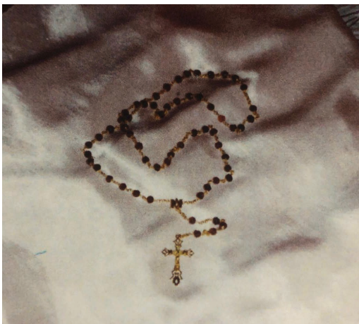
Rosario engarzado en oro

del libro de reglas, en plata. El valor del rosario en oro y trabajo ha sido de 40.000 pesetas; aunque su verdadero y gran valor radica en la estima que tenía para su donante, que no ha dudado en ofrecer a una de las imágenes de la Virgen que adora.