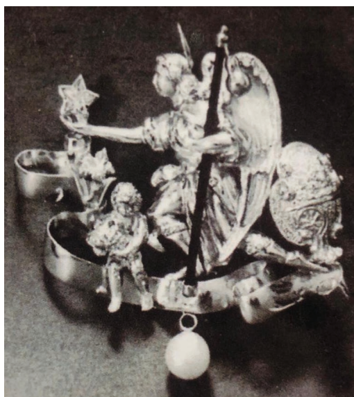
Broche San Rafael

El sábado 11 de diciembre, con el apoyo del grupo joven Sembradores de Paz, se llevó a cabo la V Cabalgata de Recogida de alimentos para las familias más necesitadas del barrio. Se recogieron alrededor de 1300 kilos de alimentos, con los que se pudieron confeccionar 32 lotes para otras tantas familias.