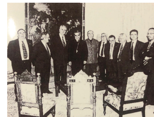
Entrevista con el Sr. Obispo