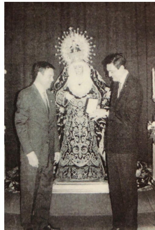
Entrega del Broche

Igualmente, acompañamos a la Virgen de la Estrella Coronada en la procesión que se celebró por la tarde de ese mismo día. Presidió nuestra representación el Bacalao de nuestra hermandad, acompañado de cuatro varas portadas por miembros de nuestra Junta de Gobierno.