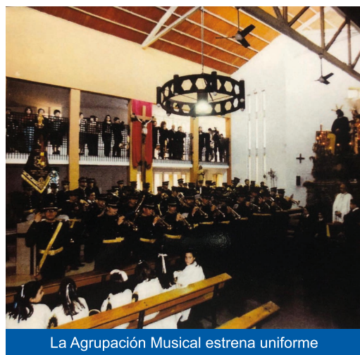
La Agrupación Musical estrena uniforme

cofradía, que se encarga de la confección de las nuevas túnicas de nazarenos para este año.