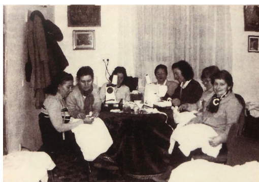
Taller de costura

El primer acto del año en 1999 es la celebración en nuestra Parroquia de la función en honor a nuestro titular el Dulce nombre de Jesús, el domingo 3 de enero; oficia el acto el Reverendo Padre Don Francisco Muñoz Córdoba. Este mismo día, los hermanos costaleros mantienen en nuestra casa hermandad la primera reunión con vistas a los ensayos para la salida de este año, el diálogo transcurre alrededor de un perol ofrecido en nuestra casa.