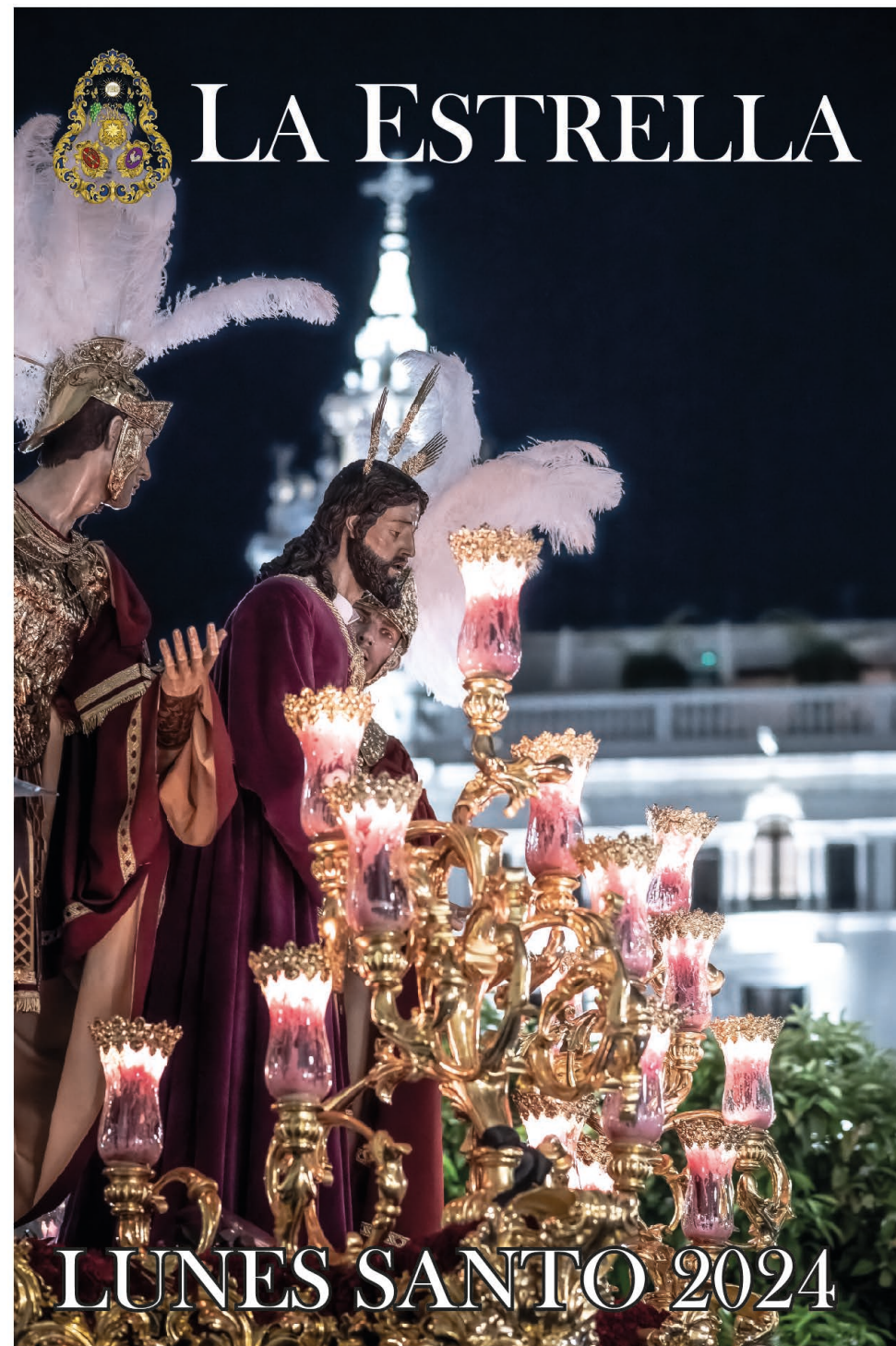
Autor: Javier Muñoz